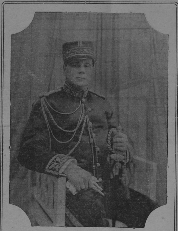
DON FEDERICO TINOCO GRANADOS PRESIDENTE PROVISORIO DE LA REPUBLICA DE COSTA RICA Y CANDIDATO POPULAR A LA PRESIDENCIA